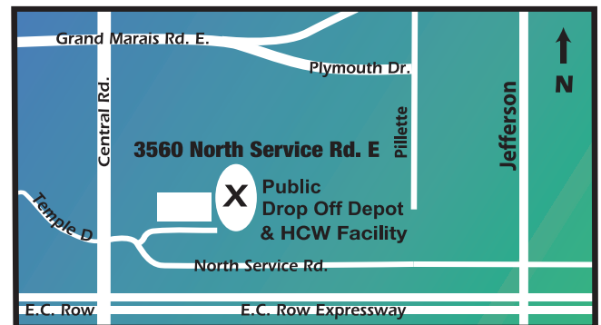
3560 North Service Rd. E